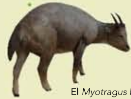
El Myotragus balearicus

b. La presència dels humans al Carnatge es degué sobretot a l'interès que els despertà el marès de la zona. En queda constància en l'explotació de les pedreres, d'on s'extragué material per a les construccions de l'època. Des de les pedreres s'observa l'illot de la Galera, que presenta importants vestigis de presència humana, entre els quals destaquen les restes d'un santuari púnic construït entre els s. IV i III aC amb grans peces de marès.