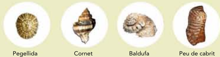
Pegellida Cornet Baldufa Peu de cabrit