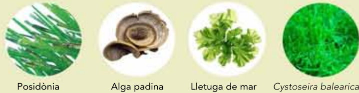
Posidònia Alga padina Lletuga de mar Cystoseira balearica